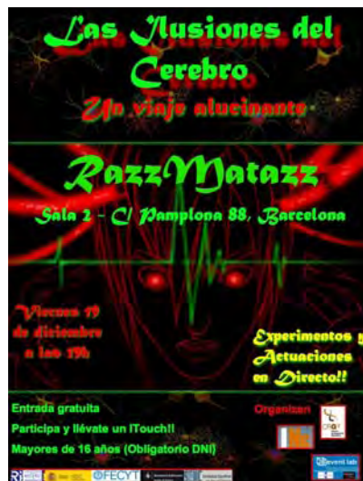
Actuació del grup de teatre i música a la sala Razzmatazz dins dels actes de la fira neurocientífica, organitzat pel centre Biomèdic.