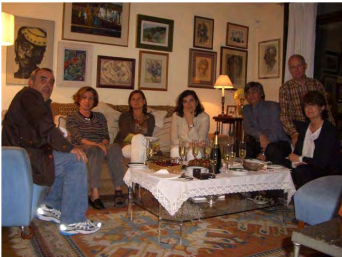
Reunió membres patronat 2008