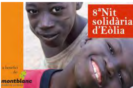
Actuació a la 8a nit solidària a favor de Montblanch Fundació privada Dilluns, 28 abril 2008. Teatre Victòria.