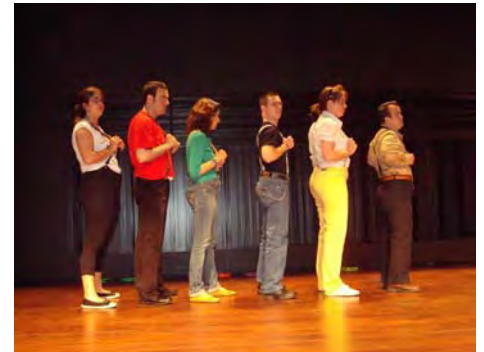
Caixa Fòrum, en el marc del XII Premi Cinematogràfic "Família" i VIII Premi Rovira- Beleta.