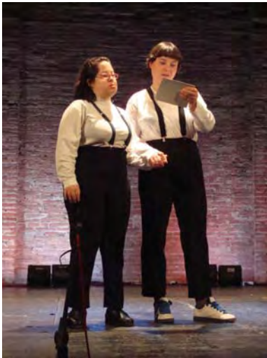
El mes de gener el teatre la Unió de Sant Cugat va oferir La nit del teatre musical .