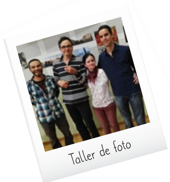
Taller de foto