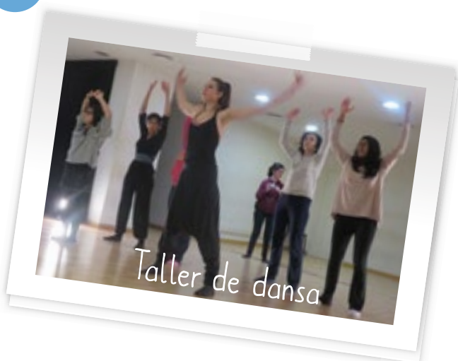
Taller de dansa

Equip humà (educadors, voluntaris i professionals)